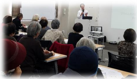
第1回、2回 プライムトークの様子